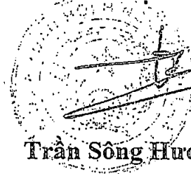
Trần Sông Hương